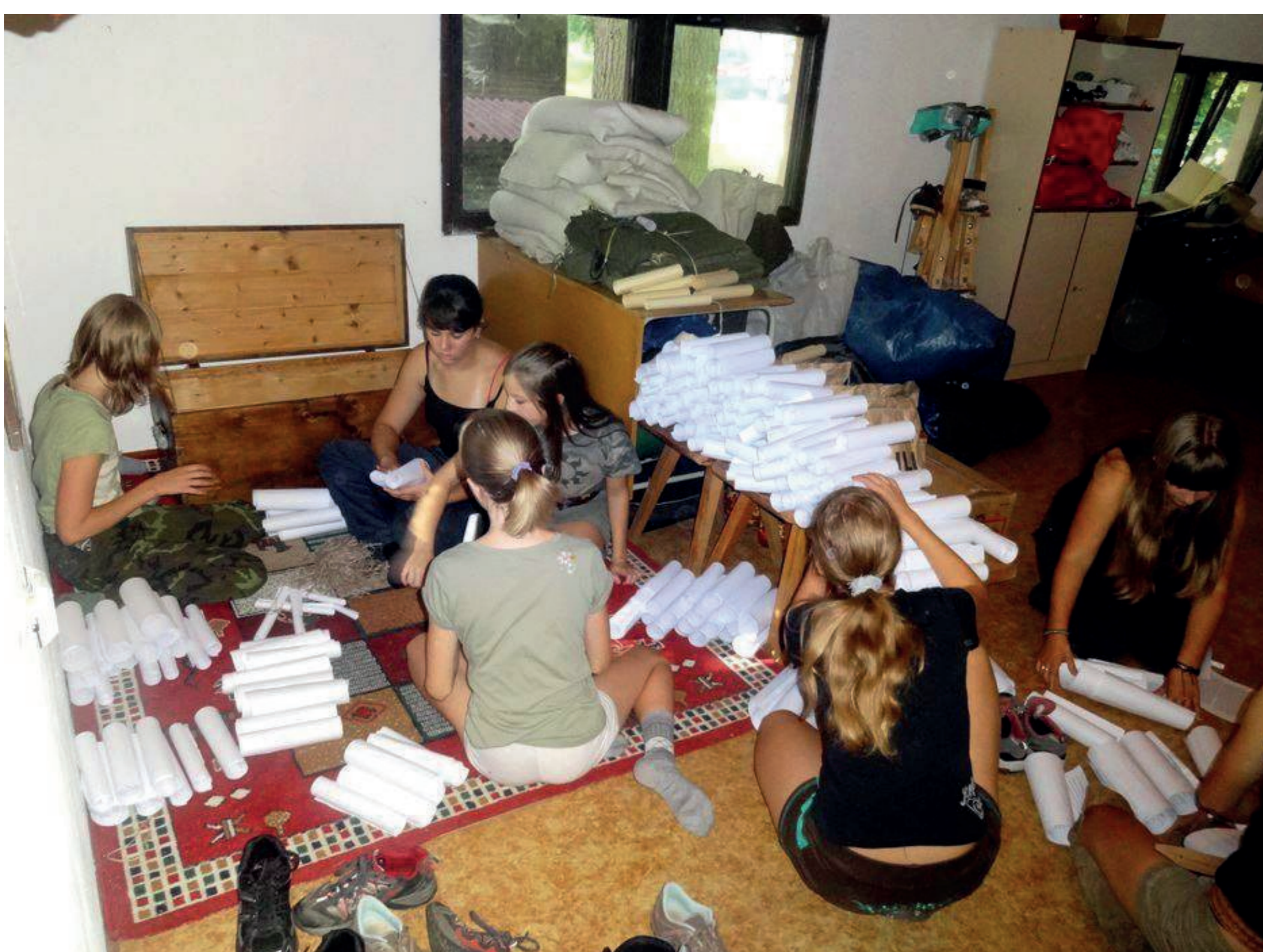
B lackadovská knihovna plná magických i poučných svitků.